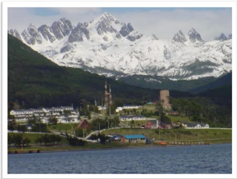
Puerto Williams, Chile

Clima, relieve, vegetación, presencia de construcciones y formas de adaptación de los habitantes.